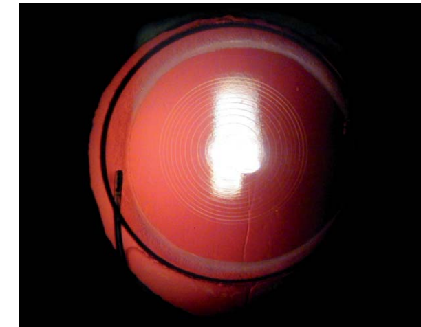
Abb. 1: Die multifokale Kunstlinse im Auge. Die zentralen Ringe erzeugen das Nahbild.

Eine Multifokale Kunstlinse weist mehrere Brennpunkte auf, daher der Begriff „multifokal“. Moderne Multifokallinsen verfügen über drei Hauptbrennpunkte, daher wird auch häufig der Begriff „Trifokal-Linse“ verwendet (Abb. 1).