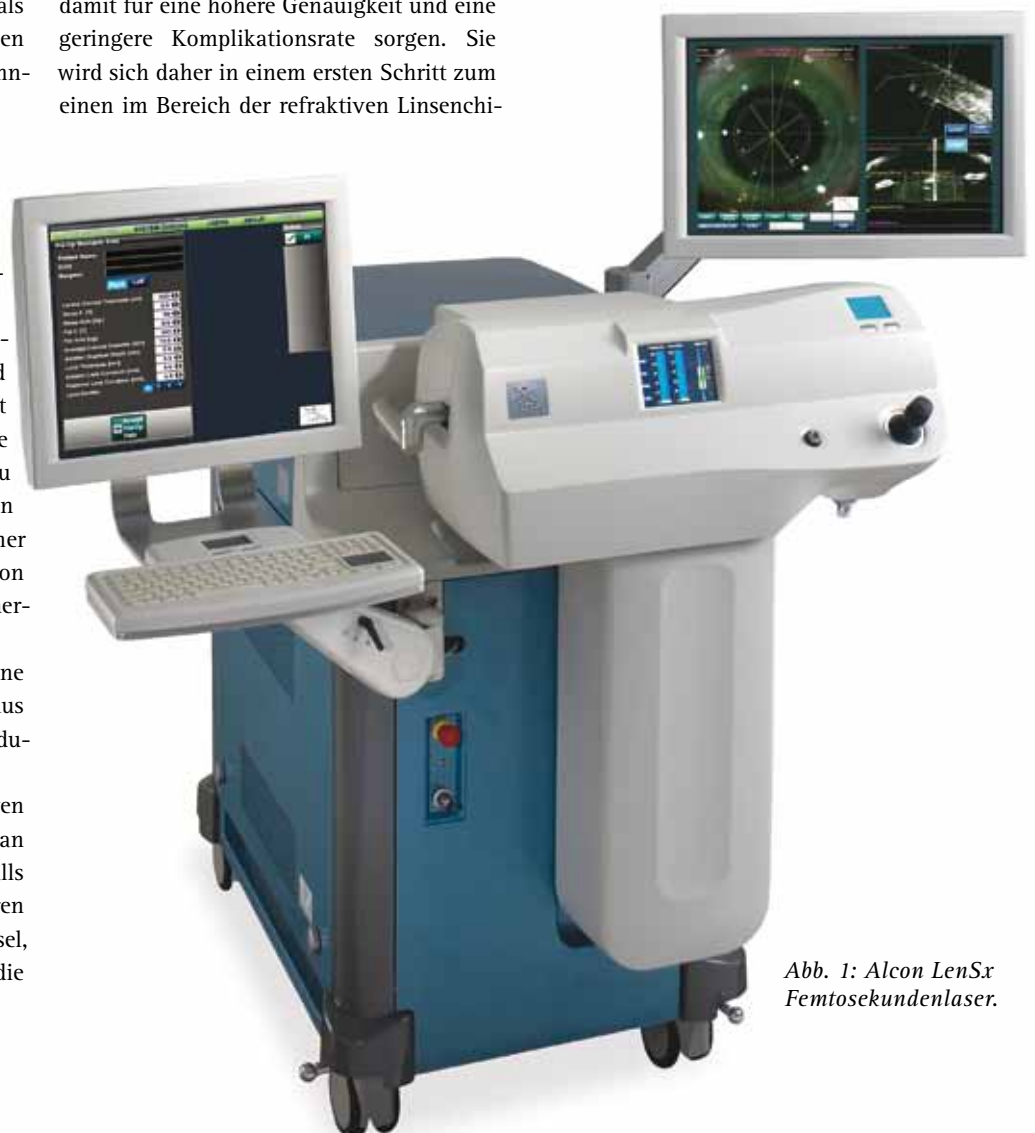
Abb. 1: Alcon LenSx Femtosekundenlaser.